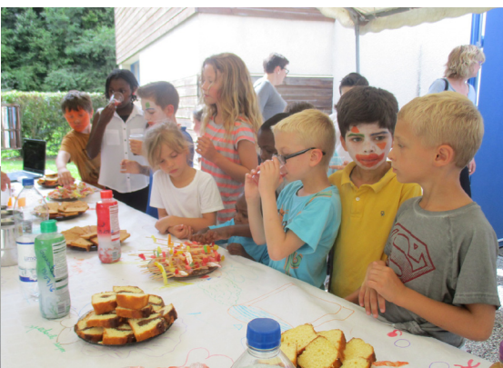
Après le spectacle offert aux parents, les enfants n'ont pas boudé le goûter !