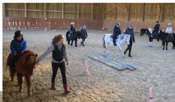
Dans le manège, chacun attend sagement son tour de piste avant de ressentir de fortes sensations.

Ils ont assisté à la projection du film d'animation Le monde de Dory , le petit poisson amnésique à la recherche de son passé. Matinée découverte aux Écuries du Pas Saint-Martin où les plus petits comme les plus grands ont fait des tours de piste à poney et appris à brosser les animaux. Ils ont aussi tâté de la pâte en tout genre : à sel, à modeler et à crêpe. Enfin, ce séjour s'est terminé avec la traditionnelle boum et le goûter avec les parents.