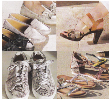
La collection été 2017 est arrivée.

♦ 2, rue du Pont-Cheminet ♦ 03 23 74 81 58 ♦ 06 17 01 54 68 ♦ peruti@orange.fr