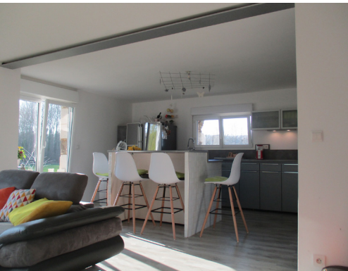
Intérieur conçu et réalisé par Jean-Christophe.