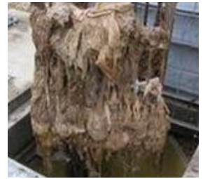
La filasse extraite des canalisations.

Biodégradables ou pas, ne jetez plus lingettes et protections dans les toilettes, s'il vous plaît !