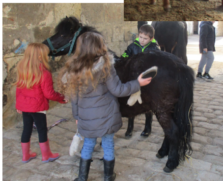
Après le plaisir, on bichonne les poneys avec la séance de brossage : même pas peur !