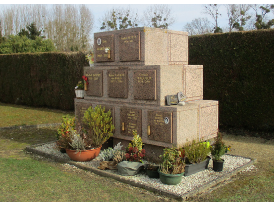
Les deux columbariums sont au fond du nouveau cimetière.

Cimetière. Il n'y avait plus de places disponibles dans le columbarium car les incinérations sont de-